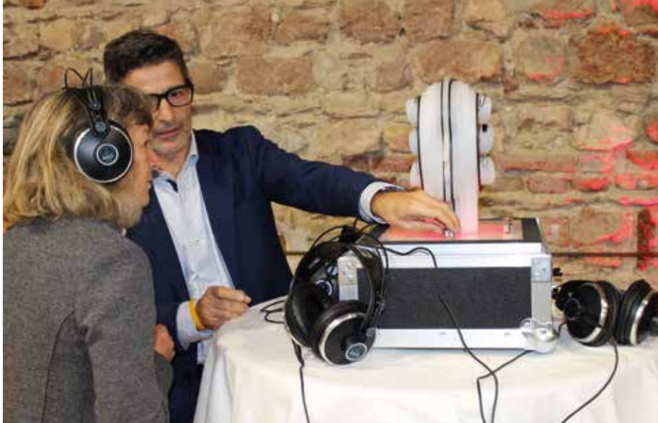
I partecipanti potevano sperimentare la percezione di suoni provenienti da modelli diversi di apparecchi acustici