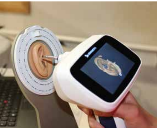
Con la scansione 3D del condotto uditivo, la produzione di auricolari personalizzati per gli apparecchi acustici diventa completamente digitale