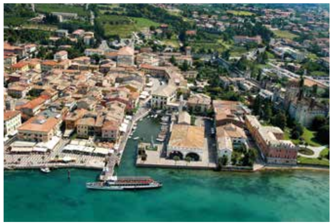
In passato le imbarcazioni dovevano transitare sotto gli archi della Dogana Veneta, prima di poter accedere al porto di Lazise

in base a specifici criteri, stabilendo poi il successivo iter personalizzato di regolazione e adattamento.