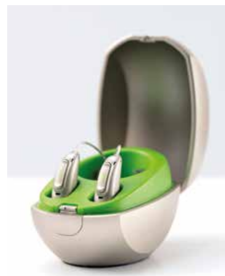
Audéo Marvel nella mini-stazione di ricarica

tegrate che ne indicano lo stato. Pratico da usare nella vita quotidiana è il mini-caricabatterie da portare con sé. In alternativa al modello ricaricabile, Audéo M è disponibile anche con batteria 312 sostituibile.