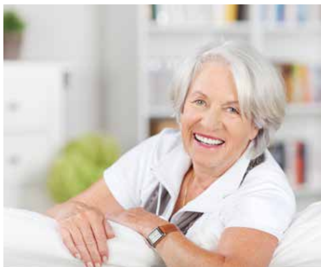
Ein Hörsystem bringt fast immer mehr Lebensqualität

Die Zahlen für Italien zeigen auch, dass Menschen mit einer festgestellten Hörminderung im Durchschnitt zwei bis drei Jahre warten, bevor sie sich für eine Hörsystemversorgung entscheiden. Dies, obwohl gut zwei Drittel (67 %) der Träger nach dem Erwerb angeben, dass sich ihr soziales, berufliches, emotionales und ihr Beziehungsleben deutlich verbessert haben. Sogar noch deutlich mehr Betroffene (83 %) empfinden, dass sie sich mit Hörsystemen in städtischer Umgebung sicherer fühlen. Fast alle Befragten (97 %) bestätigen eine deutliche Verbesserung ihrer Lebensqualität dank ihrer Hörhilfen. Die Akzeptanz ist also insgesamt hierzulande hoch. Ganz allgemein sind knapp 80 Prozent der Nutzer mit ihren Hörsystemen zufrieden, das liegt im europäischen Durchschnitt. Für 87 Prozent funktionieren die Hörsysteme besser oder wie erwartet, vor allem bei