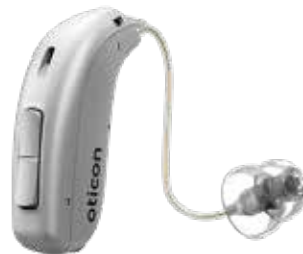
Oticon Jet als HdO-Lösung MiniRITE

Zur Oticon Jet-Familie gehören sowohl Hinter-dem-Ohr-Hörsysteme als auch Im-Ohr-Hörsysteme, wobei die Modell-palette vom eleganten miniRITE bis zum maßgefertigten und winzigen IIC reicht. Die Zelger Hörexper-ten beraten Sie gerne hinsichtlich des passenden Modells. 📞