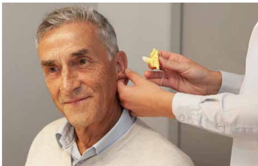
Grazie al rilevamento dell'impronta da parte dell'audioprotesista, l'auricolare di ogni apparecchio acustico viene realizzato su misura

La redazione si riserva di selezionare le domande pervenute (con indicazione del mittente) e di apportare eventuali tagli/adequamenti linguistici.