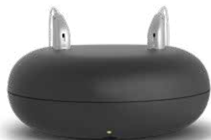
Apparecchi Ruby nella stazione di ricarica (grandezza 1:2)

Così l'utente può percepire suoni provenienti da ogni direzione e sentire chi gli parla da entrambe le orecchie. I sistemi CROS sono disponibili sia in versione retroauricolare, discreta e praticamente invisibile, che in versione endoauricolare. 📞