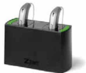
...e l'apposita stazione di ricarica

gia per l'udito”. Gli esperti dell'udito Zelger consigliano quindi vivamente di testare gli apparecchi acustici prima dell'acquisto. Nel periodo di prova, infatti, l'utilizzatore ha l'opportunità di abituarsi gradualmente agli apparecchi e alla nuova situazione uditiva e di verificare attentamente che si adattino al suo stile di vita personale.