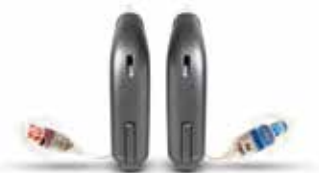
I nuovi apparecchi OPN ricaricabili (grandezza naturale)...

Oltre alle maggiori funzioni per la comprensione del parlato e a un suono più