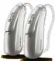
I nuovi apparecchi Audéo B-Direct (grandezza naturale)

Il nuovo apparecchio acustico Audéo B-Direct si collega direttamente a qualsiasi telefono cellulare (Bluetooth® 4.2 LE o Bluetooth standard dalla versione 2.1), consentendo così di telefonare davvero a mani libere. Gli utilizzatori possono accettare o rifiutare la chiamata tramite il tasto dell'apparecchio acustico, senza dover prendere in mano il telefono. Quando si risponde alla chiamata, la rete microfonica intelligente dell'apparecchio acustico riconosce la voce del portatore e la trasmette direttamente